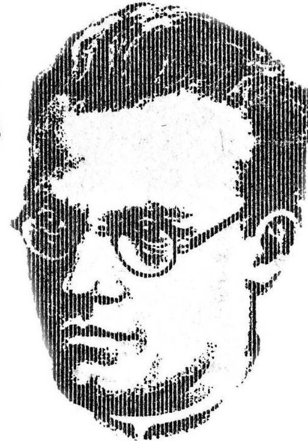
Alfred Delp SJ † 2.2.1945