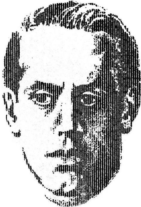
Helmuth James Graf von Moltke † 23.1.1945